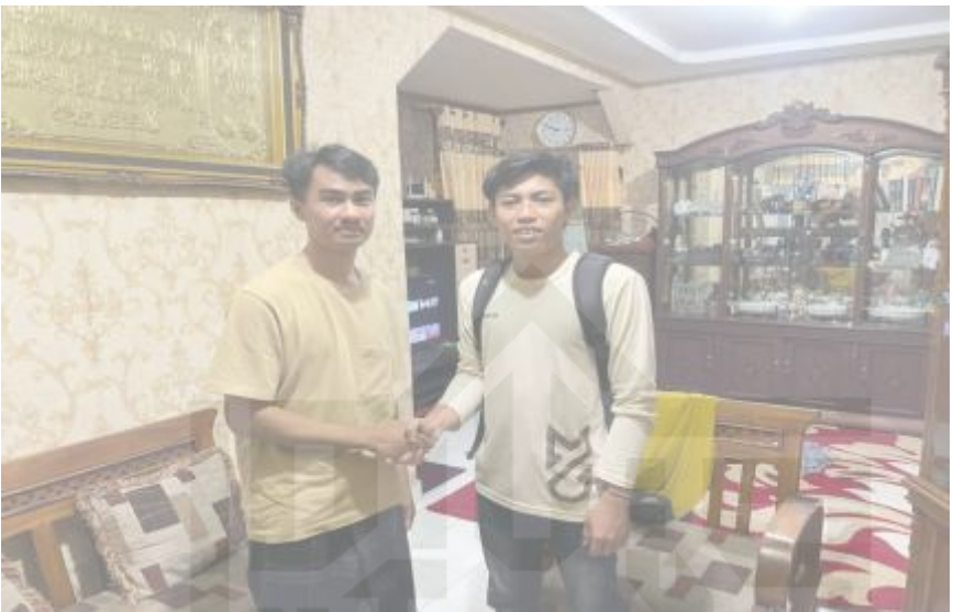
Wawancara Dengan Pemilik Kapal Angkutan Bapak Bakti