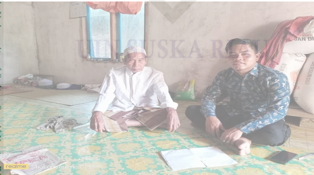
Wawancara Bersama Kepala Desa Suka Maju