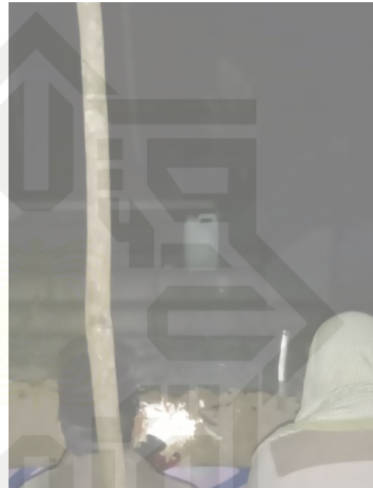
Wawancara Bersama Tokoh Masyarakat Desa Suka Maju