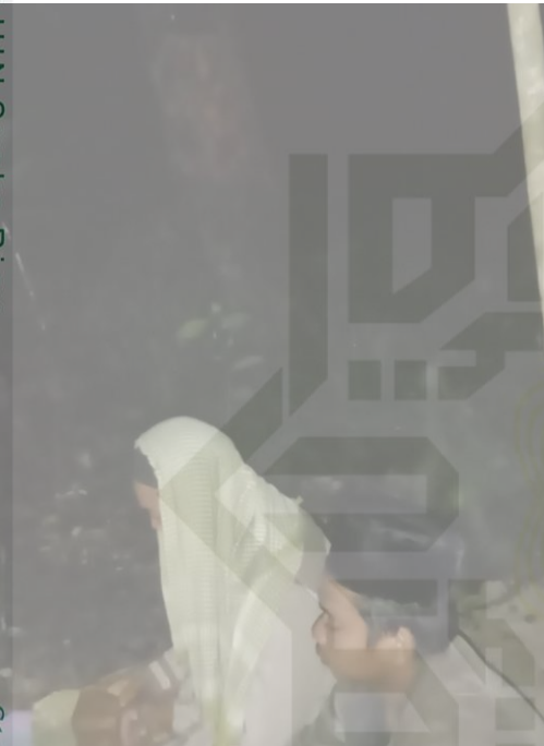
Foto Dokumentasi Tradisi Talqin Di Waktu Do'a Mustajab Di Desa Batang Samo Kecamatan Rambah Kabupaten Rokan Hulu (Studi Living Hadis)