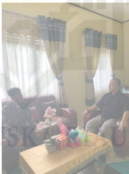
Gambar 4. Wawancara Bersama Pak Kepsek