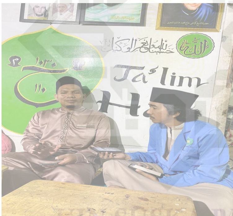
Gambar 3. Wawancara dengan ustadz serta pendiri majelis ta'lim faizhul haq