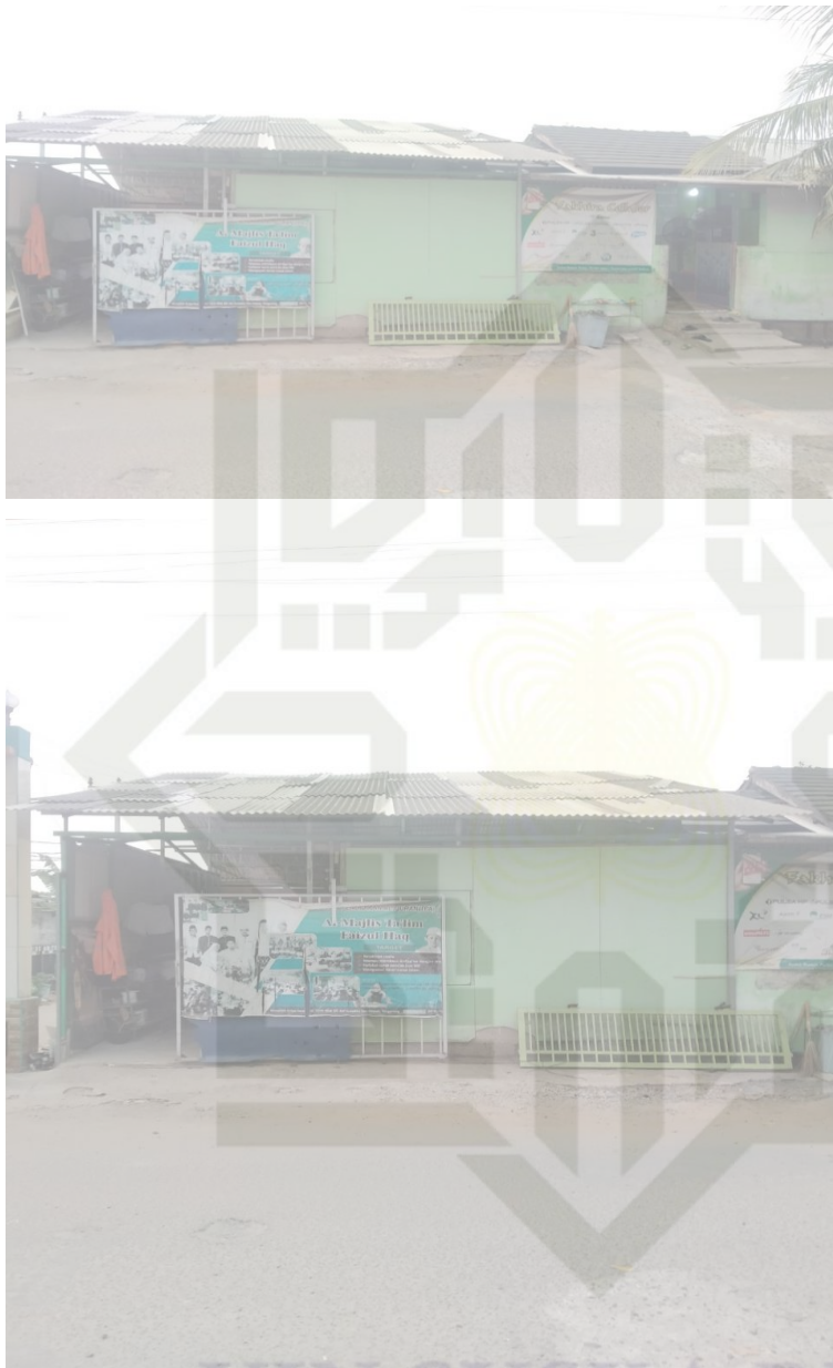
Gambar 1. Majelis Ta'lim Faizhul Haq