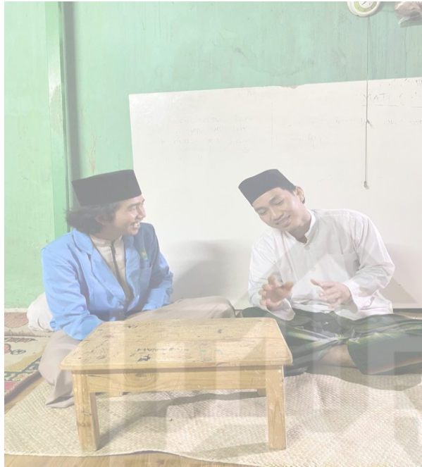
Gambar 4. Wawancara dengan salah satu pembaca kitab simtuddurror