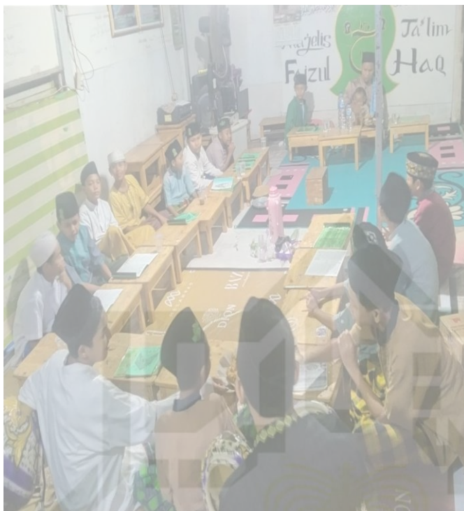
Gambar 6. Pelaksanaan pembacaan kitab simtuddurror