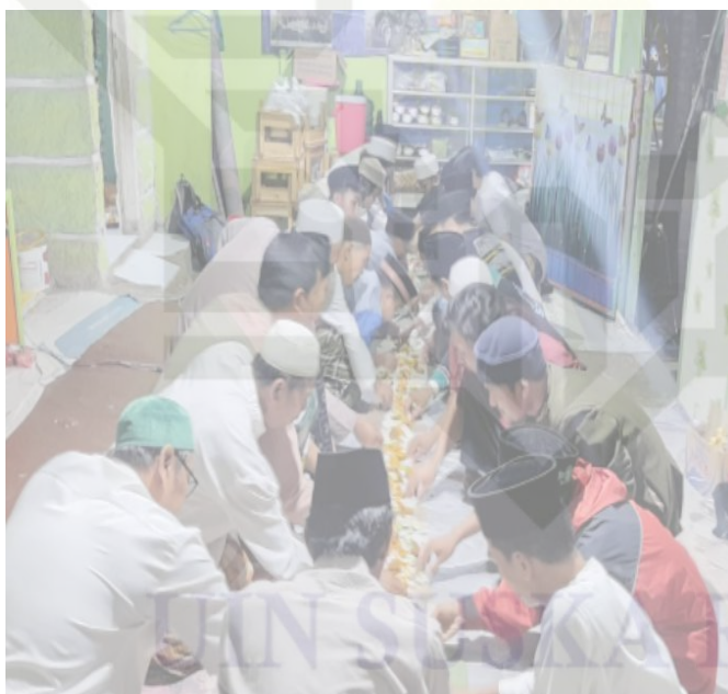
Gambar 7. Makan bersama setelah pelaksanaan pembacaan kitab simtuddurror