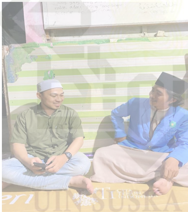
Gambar 5. Wawancara dengan salah satu pembaca kitab simtuddurror