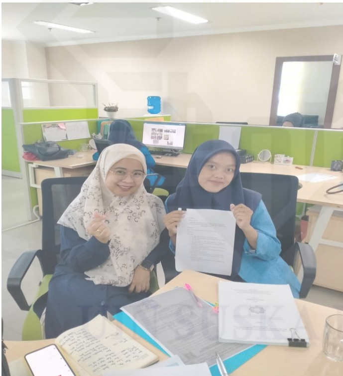
Wawancara dengan Bidang Ketahanan dan Kesejahteraan Keluarga (Satgas Stunting)