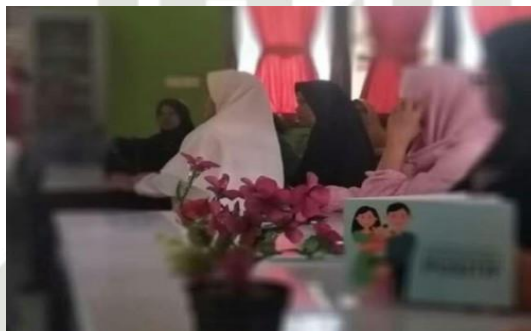
Gambar 2.3 Penyuluhan Untuk Orang Tua

untuk meningkatkan pemahaman orang tua tentang mengasuh dan mendidik anak, meningkatkan partisipasi orang tua dalam pendidikan anak sebagai wadah berbagi di sekolah dan di rumah dan praktik yang baik dalam membesarkan dan mendidik anak di antara orang tua, adanya keselarasan dalam pengajaran antara yang dilakukan di sekolah maupun di rumah (Sukiman, 2017)