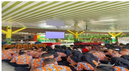
Gambar 2.4 Sosialisasi Untuk Anak