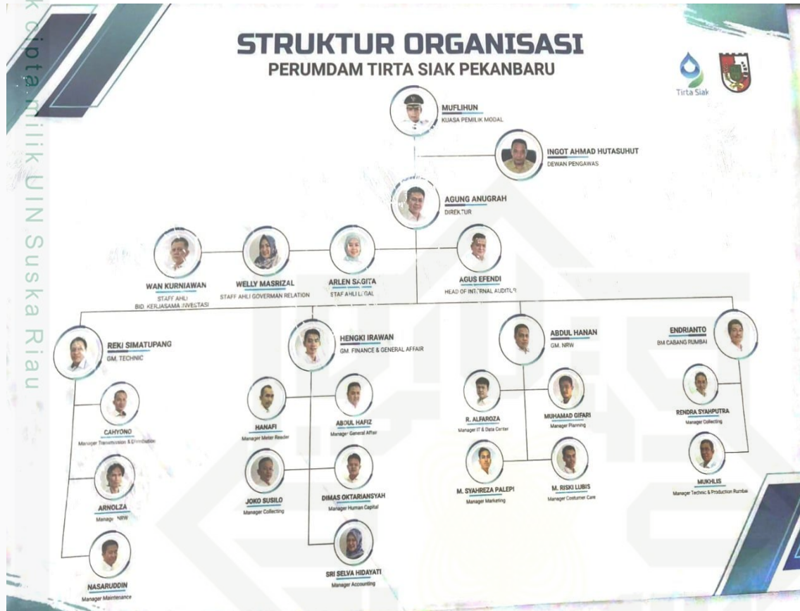
Gambar 4. 1 Struktur organisasi PDAM Tirta Siak