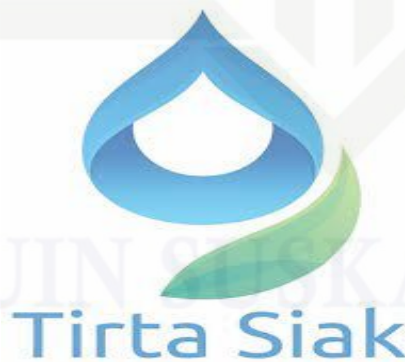
Gambar 4.2 Logo PDAM Tirta Siak