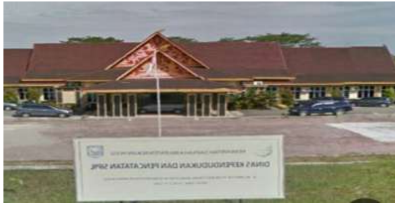
Gambar III.1 Dinas Kependudukan dan Pencatatan Sipil Kabupaten Rokan Hulu