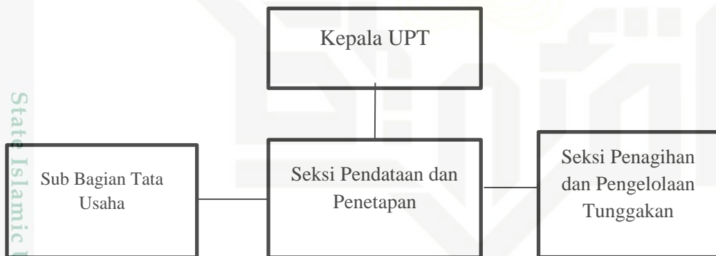
Gambar 2.1 Struktur Organisasi Samsat Baserah

Berdasarkan Peraturan Badan Pendapatan Provinsi Riau tentang Organisasi dan Tata Kerja Instansi , struktur organisasi Kantor Samsat Baserah disusun sesuai dengan fungsi yang telah ditetapkan oleh Badan Pendapatan Proyinsi Riau terdiri dari: