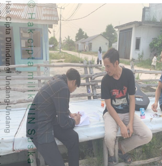
© Hak cipta milik UIN Suska Riau