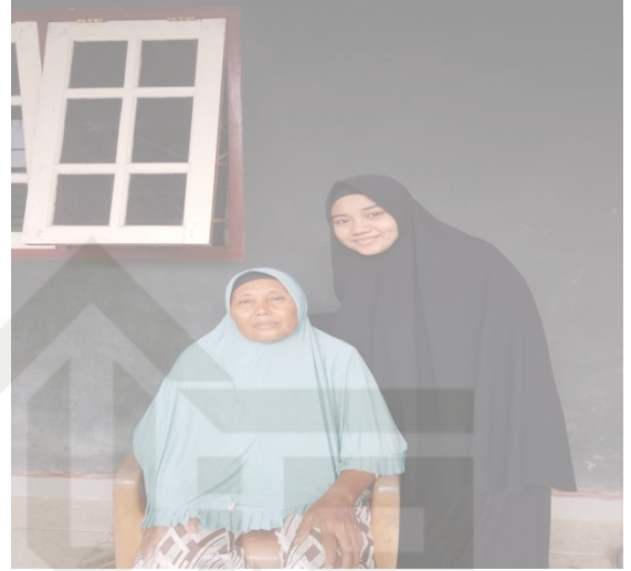
Wawancara Oppung Kembar