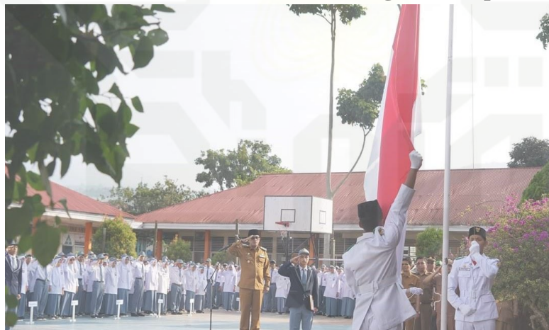
Gambar 4.1 Gambar Profil Sma Negeri 1 Batipuh