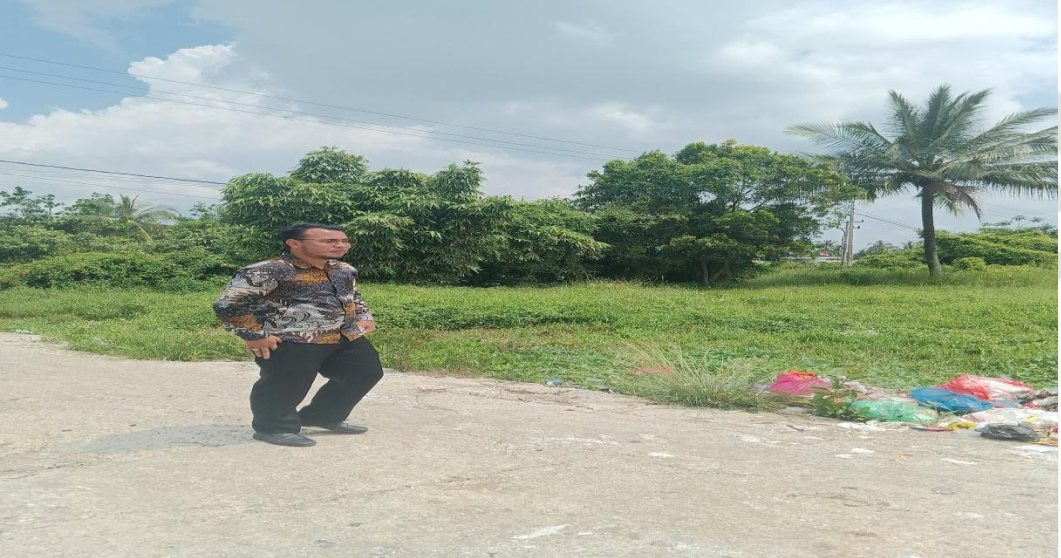
Lokasi TPS (Tempat Pembuangan Sampah) di Desa Gogok , Pada Tanggal 13 November 2023 di Desa Gogok