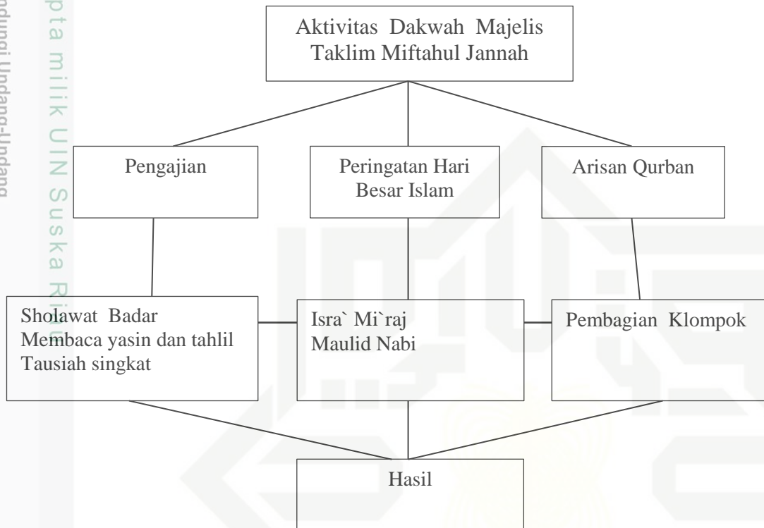
Gambar 2.1 Kerangka Fikir