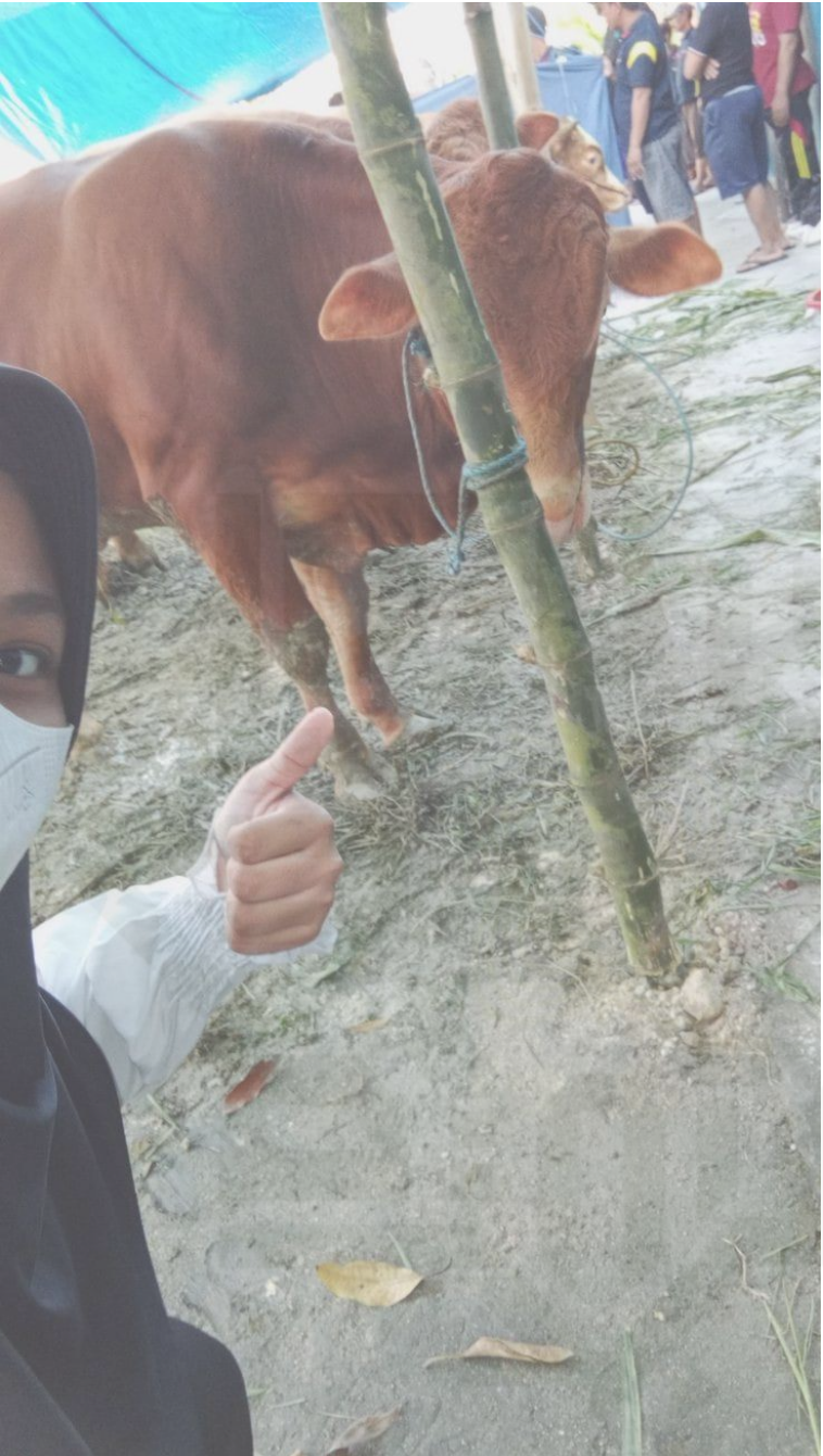
Sebelum di sembelih