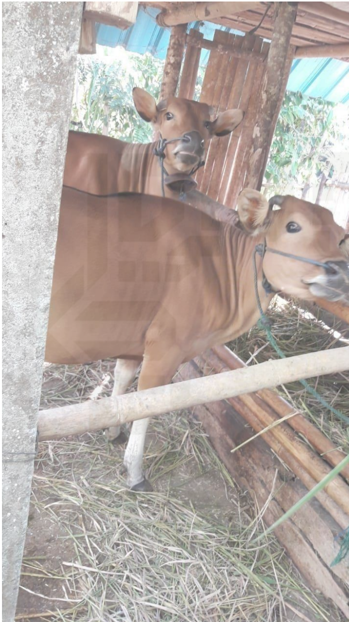
Sapi dikandang proses pengurusan