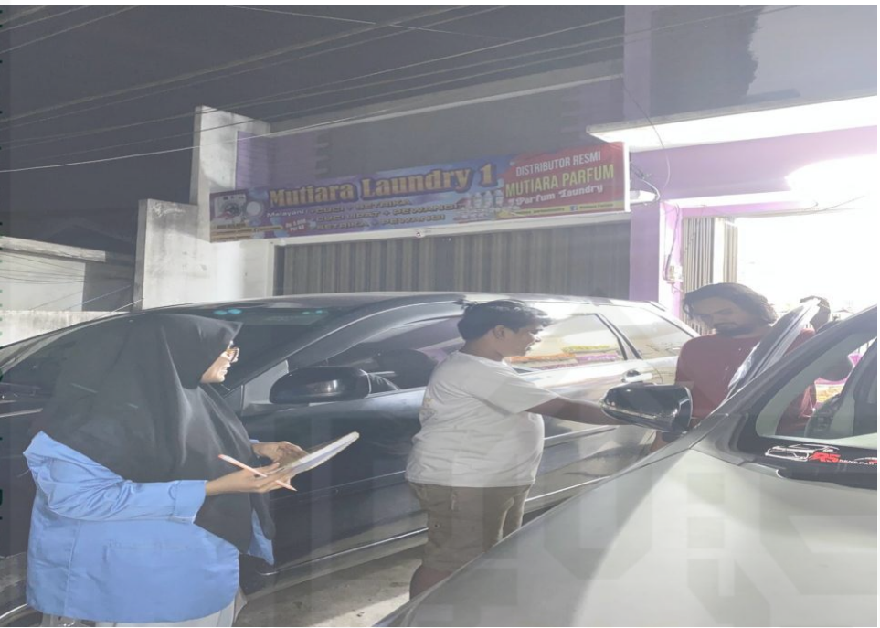
© Hak cipta milik UIN Suska Riau