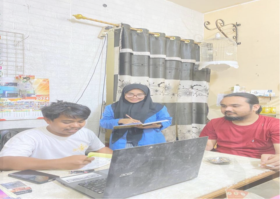
© Hak cipta milik UIN Suska Riau