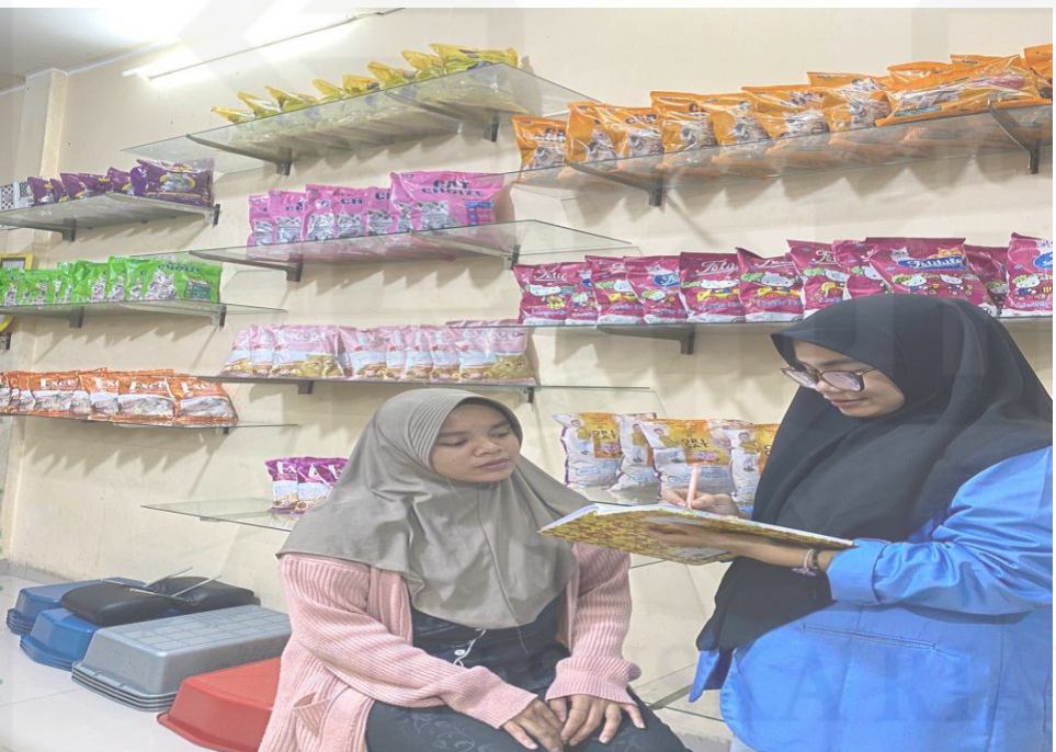
State Islamic University of Sultan Syarif Kasim Riau