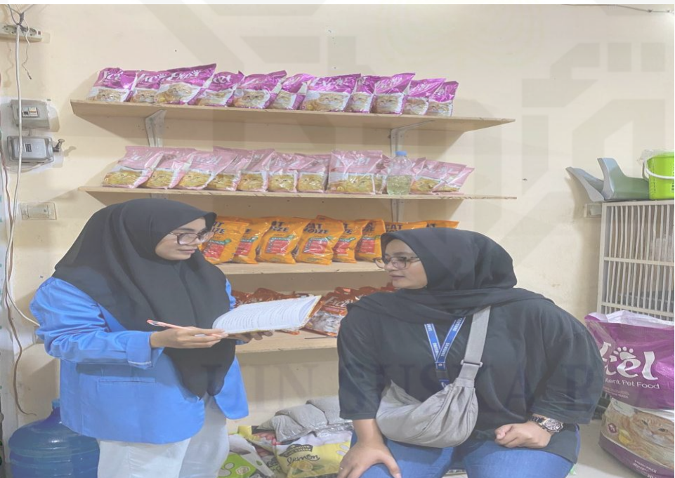
State Islamic University of Sultan Syarif Kasim Riau