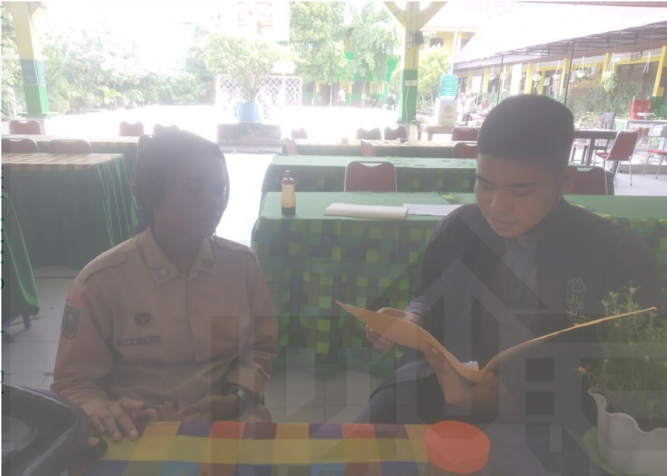
Bersama Pengurus OSIS Sekolah Menengah Atas Negeri 7 Pekanbaru