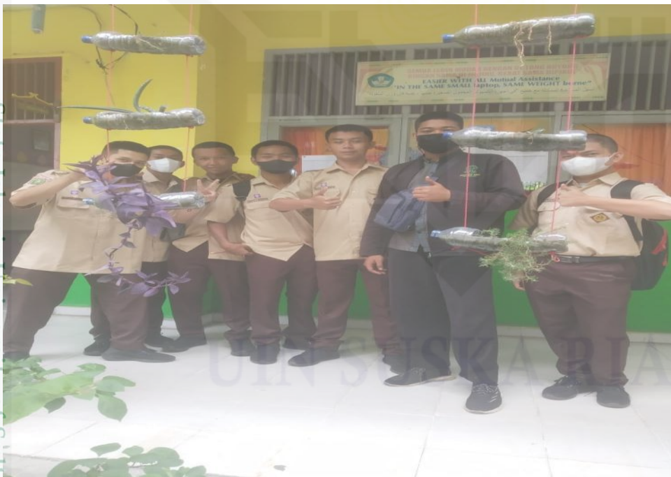
Bersama Siswa Sekolah menengah Atas Negeri Pekanbaru