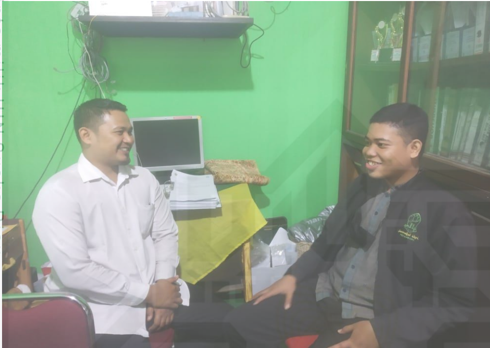
Bersama Staf Kesiswaan Sekolah menengah Atas Negeri Pekanbaru