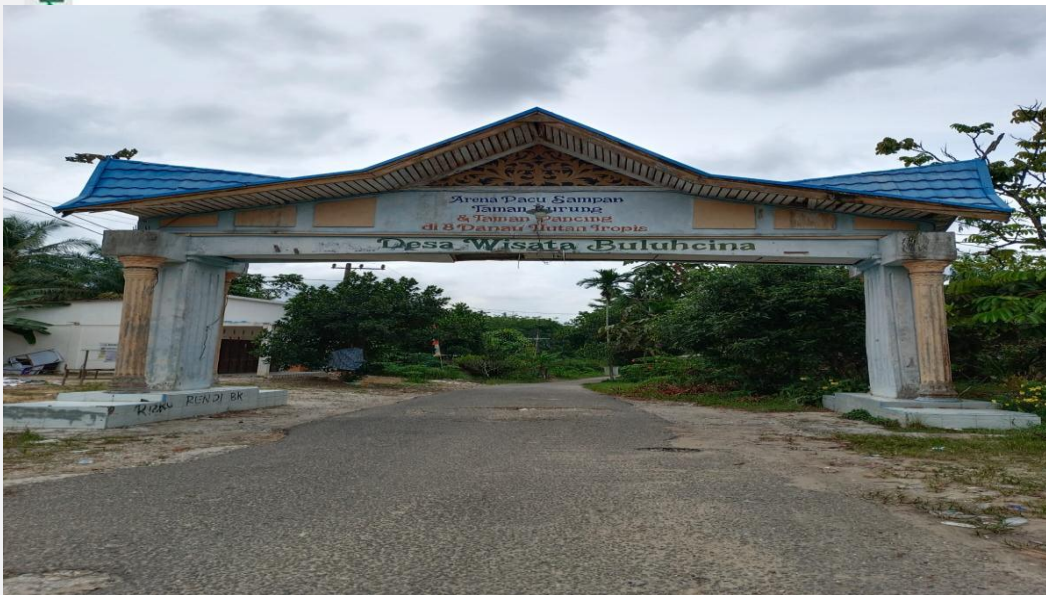
Gambar 1 : Gerbang masuk desa buluhcina diambil pada Februari 2023