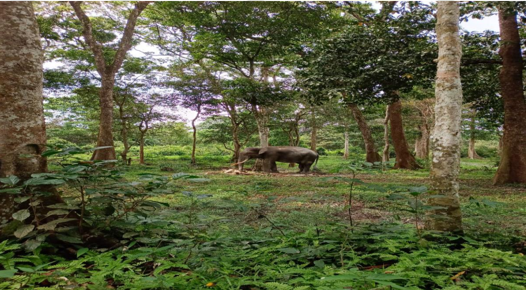
Gambar 6 : Wisata atraksi gajah Danau Pinang Dalam diambil pada Februari 2023.