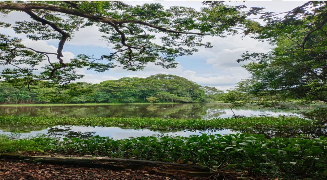
Gambar 8 : Pemandangan Danau Tanjung Putus Desa Buluhcina diambil Februari 2023.