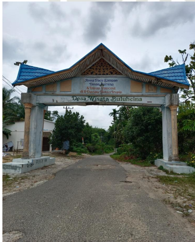
Gambar 4. 1. Wisata Buluhcina