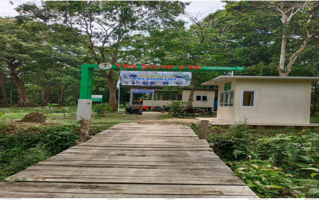
Gambar 7 : Taman Wisata Alam Buluhcina yang dikelola bersama BKSDA diambil pada Februari 2023.