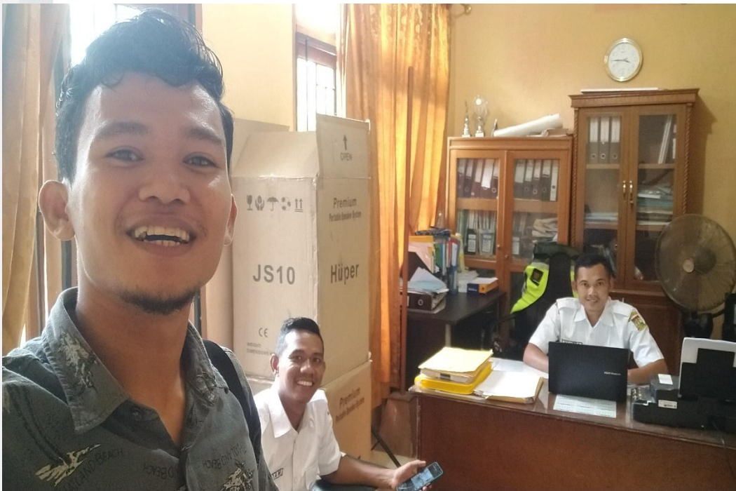
Gambar 3: Foto bersama sekretaris kepala desa & ketua pengelolaan wisata diambil Februari 2023.