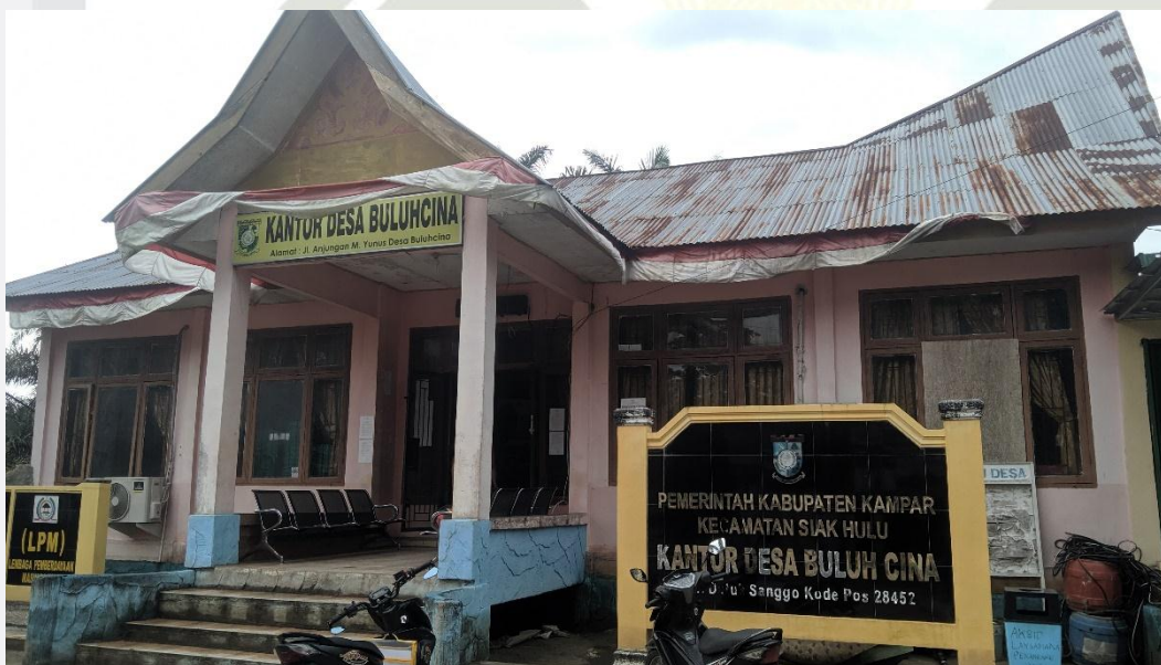
Gambar 2 : Kantor desa Buluhcina diambil pada Februari 2023