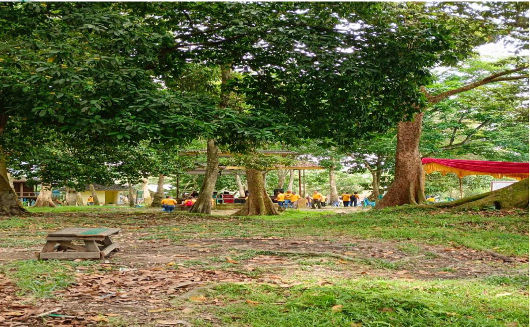
Gambar 9 : Foto pengunjung wisata daimbil pada November 2023.