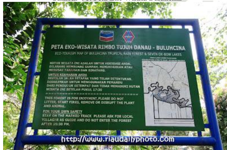
Gambar 4.3. Peta Eko Wisata Buluhcina

dalam bediki dabano ini berisikan nasehat-nasehat dan ajaran-ajaran agama yang harus dilaksanakan atau dipraktekkan dalam kehidupan sehari-hari, dan berikan larangan yang harus ditinggalkan. Terakhir adalah, Calempong Calempon sudah banyak dikenal pada masyarakat Riau pada umumnya, dan Kabupaten Kampar khususnya. Calempong merupakan alat kesenian yang ada, yang biasanya dipergunakan pada acara-acara : adat, pernikahan, dan upacara-upacara dalam menyambut tamu penting. Dari berbagai potensi tersebut, yang menjadi unggulan dari Taman Wisata Alam Buluh Cina adalah atraksi Gajah Sumatera, Hammock, Rakit Kayu, objek wisata untuk lokasi pre wedding, dan perahu yang digunakan untuk bersampan menyusuri danau.