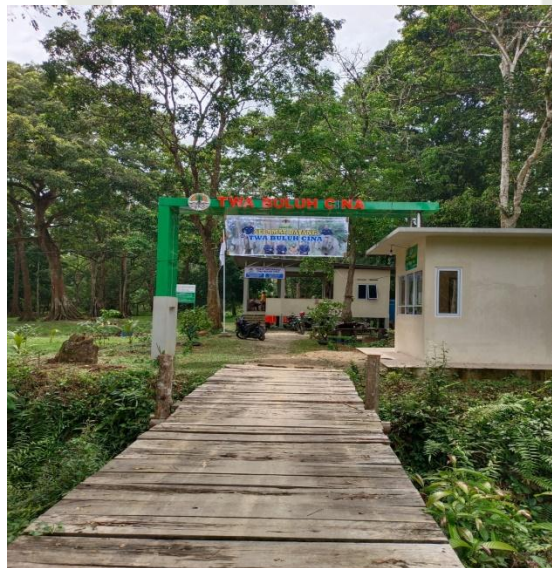
Gambar 4. 2. Taman Wisata Alam Buluhcina

Masyarakat ataupun pemuda disini sangat ramah terhadap siapapun, mereka akan menyambut kedatangan siapapun dengan ramah, mereka membantu pengunjung sebagai pemandu wisata dan jika wisatawan ingin menikmati kuliner