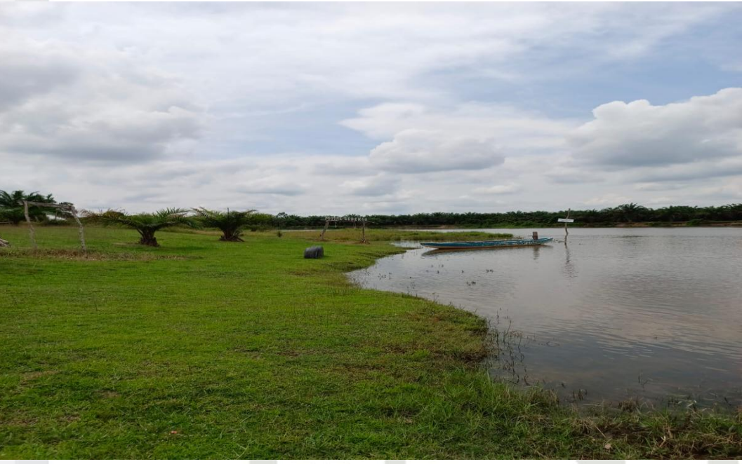
Gambar 5 : Pulau Scatter, lokasi wisata perkemahan dan piknik diambil pada Februari 2023.