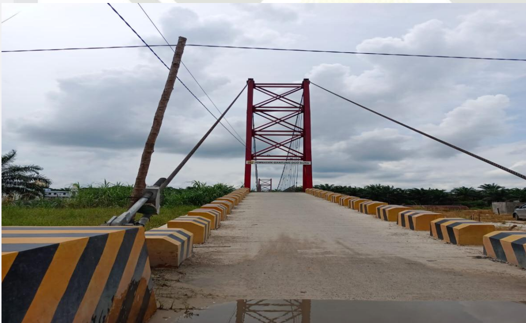
Gambar 4 : Jembatan Gantung Duo Suku, akses wisata seberang diambil pada Februari 2023.