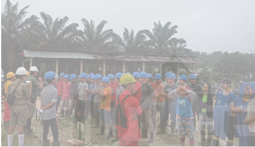
(Karyawan-karyawati PT Mitra Unggul Pusaka (MUP) Kebun Segati)