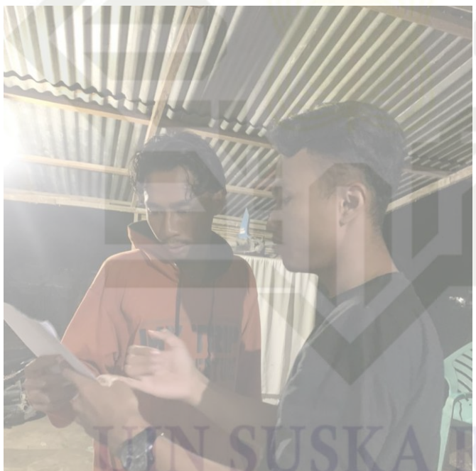
(Menyebarkan angket penelitian)