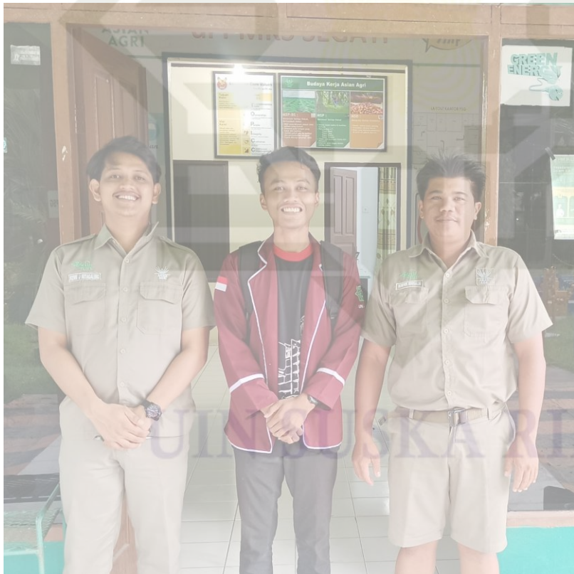
(Pimpinan PT Mitra Unggul Pusaka (MUP) Kebun Segati)