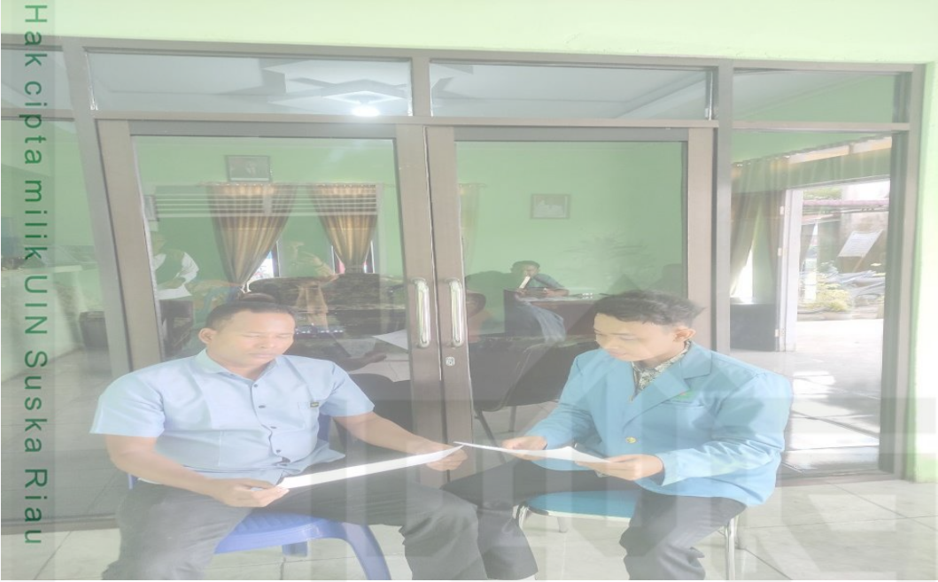
Wawancara bersama Penerima Bantuan Hukum dari Sekretariat Daerah Kabupaten Rokan Hulu, yang telah didampingi oleh Advokat Yayasan Lembaga Bantuan Hukum Sahabat Keadilan Kabupaten Rokan Hulu.