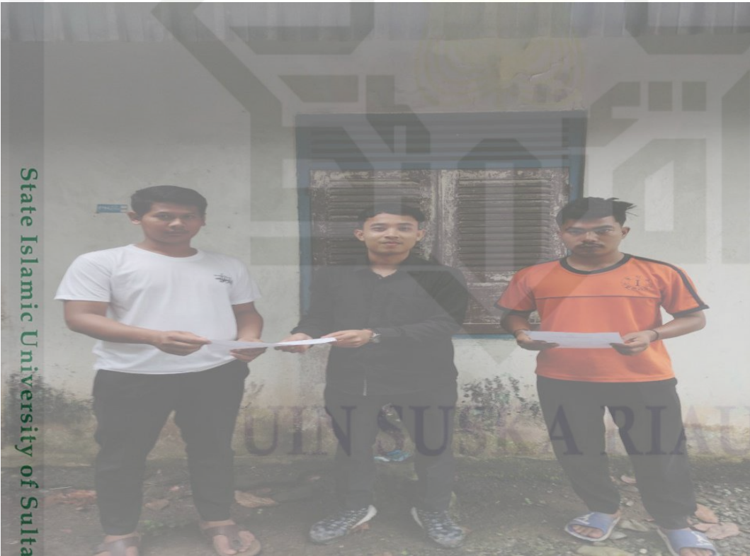
Wawancara bersama Penerima Bantuan Hukum dari Sekretariat Daerah Kabupaten Rokan Hulu yang telah didampingi oleh Advokat Yayasan Lembaga Bantuan Hukum Sahabat Keadilan Kabupaten Rokan Hulu.