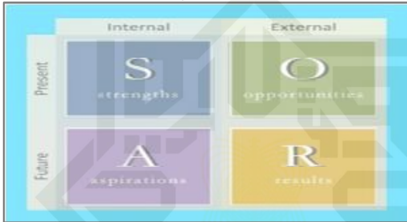
Gambar 3.1 Matriks SOAR