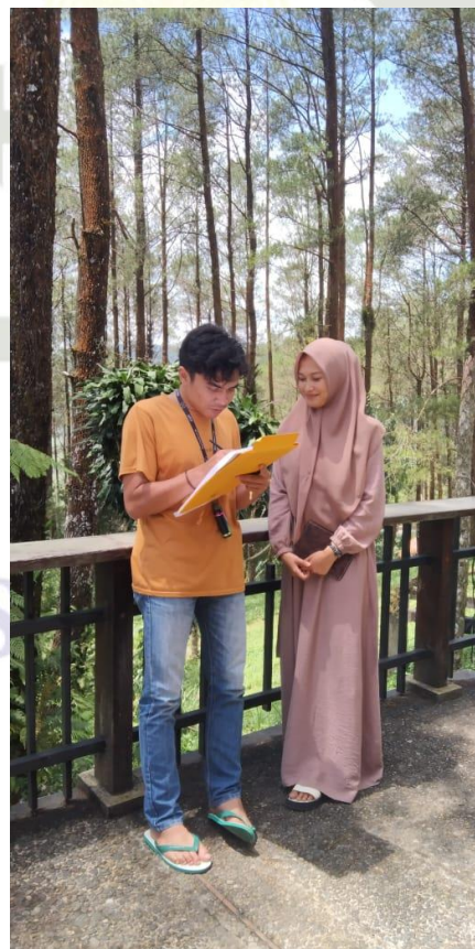
Pengunjung wisata Puncak Lawang