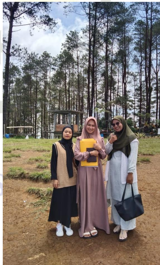
Pengunjung wisata Puncaka Lawang