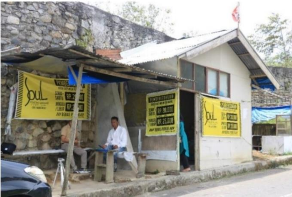
Loket pembelian tiket wisata Puncaka Lawang