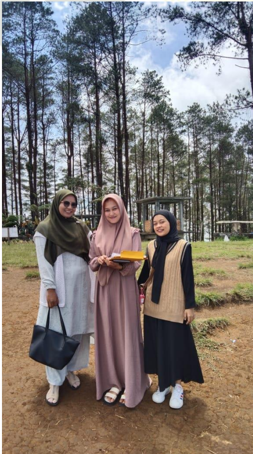
Pengunjung wisata Puncak Lawang