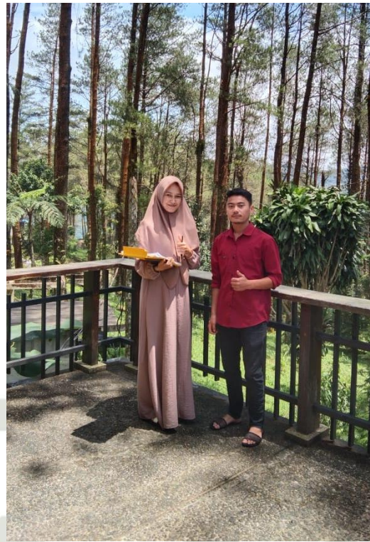
Pengunjung wisata Puncak Lawang