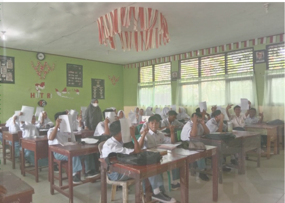
© Hak cipta milik UIN Suska Riau