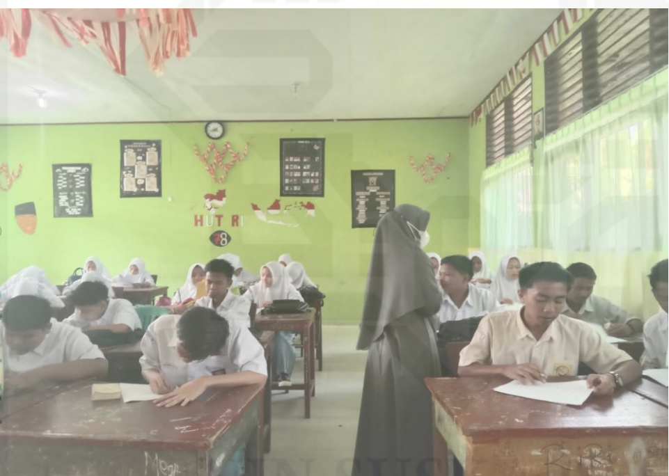
State Islamic University of Sultan Syarif Kasim Riau