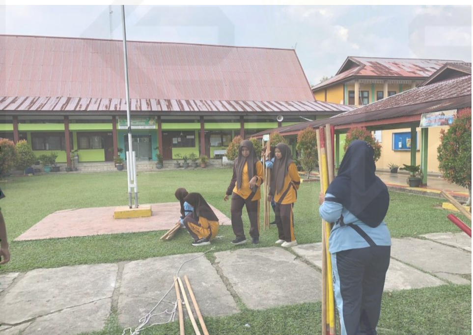
State Islamic University of Sultan Syarif Kasim Riau