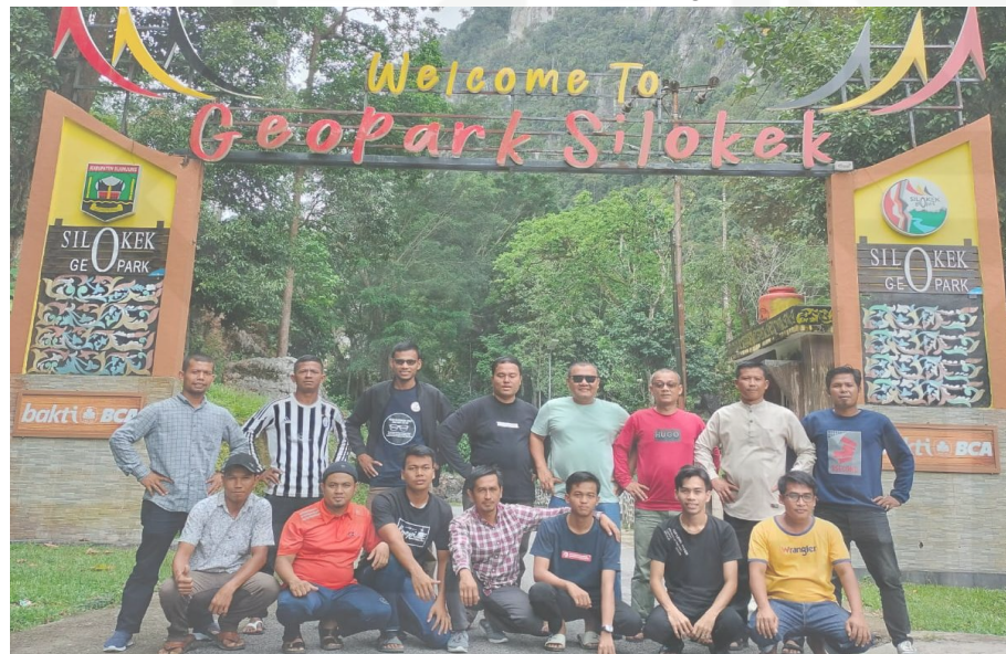
Gambar 4.3 Rekreasi IREMAS Al-Muhajirin

Program rekreasi yang dilakukan oleh para remaja masjid adalah melaksanakan rihlah secara rutin ke berbagai tempat wisata, rihlah merupakan perjalanan mentadabburi alam dengan maksud dan tujuan yang baik, manfaat yang akan dirasakan oleh para anggota remaja masjid adalah menguatkan solidaritas, mengukuhkan rasa ukhwah, dan membangun kebersamaan dan rasa peduli terhadap sesama. Program rihlah dilakukan beberapa kali dalam sebulan pada hari minggu, mayoritas yang mengikuti program rihlah adalah berasal dari anggota remaja masjid yang laki laki.