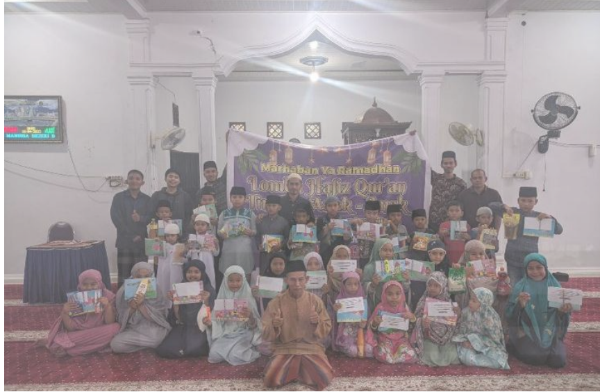
Gambar 4.4 Event Lomba pada bulan Ramadhan