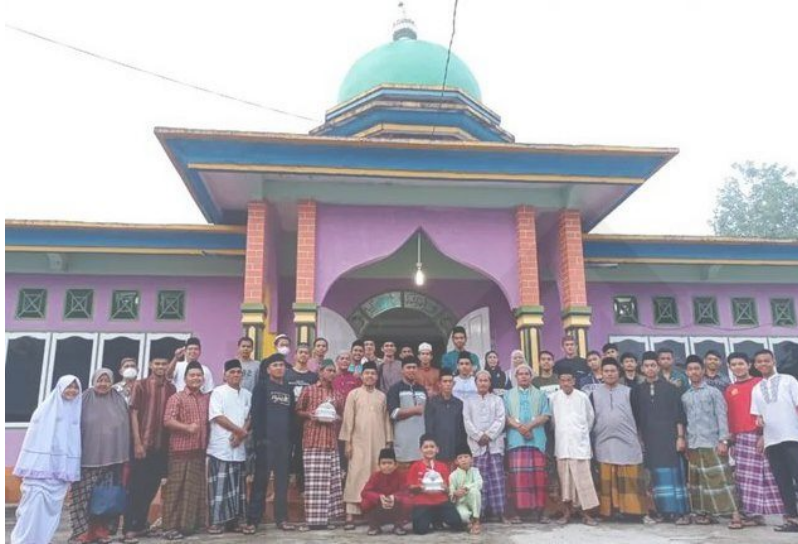
Gambar 10 Dokumentasi Program Berbagi Rezeki