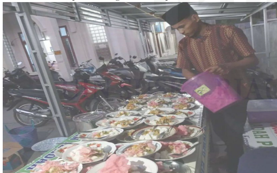
Gambar 4.2 Persiapan Berbagi Rezeki kepada Jama'ah

Ikatan Remaja Masjid Al-Muhajirin memiliki program berbagi rezeki berupa sarapan pagi dan kopi yang diselenggarakan setiap satu kali dalam seminggu dalam acara NGOPI. Makanan dan minuman tersebut diberikan kepada para jama'ah yang hadir pada acara tersebut. Para donatur yang tergabung dalam program sedekah jariyah akan memberikan sedekah berupa uang yang akan dimanfaatkan untuk membeli makanan dan kebutuhan pokok tersebut.