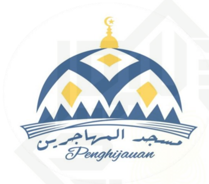
Gambar 4.1 Logo IREMAS Al-Muhajirin