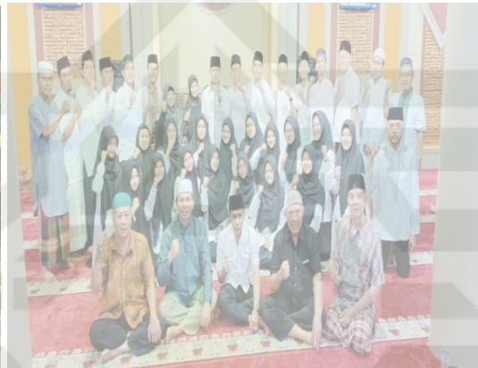
Gambar 4 Remaja Masjid Sab'atun Indra