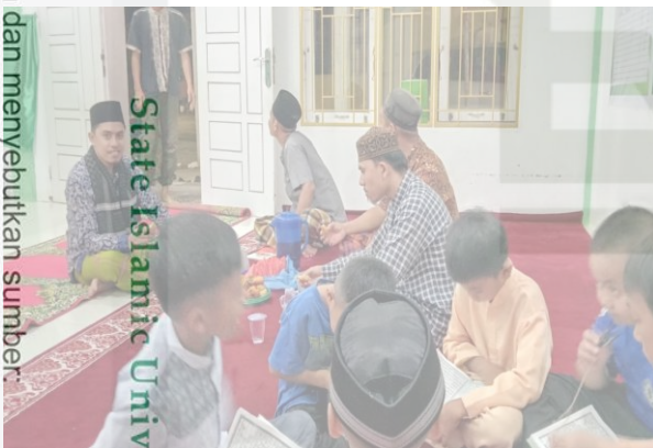
Gambar 5 Tadarus Al-Qur'an di Masjid Sab'atun Indra