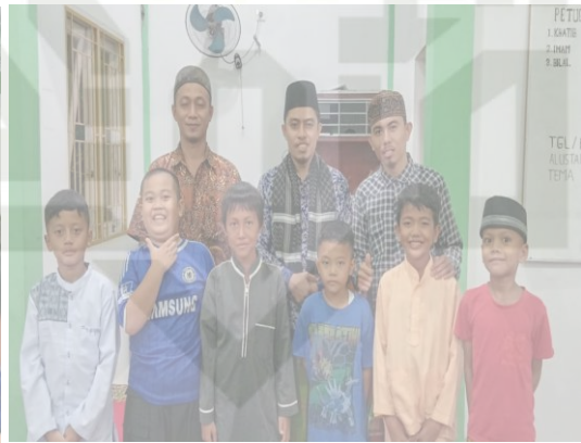
Gambar 6 Imam, Takmir dan Anak-anak Sholeh Masjid Sab'atun Indra

State Islamic University of Sultan Syarif Kasim R