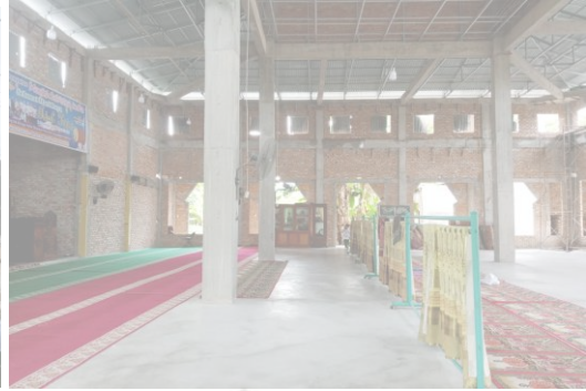
Gambar 2 Masjid Sab'atun Indra