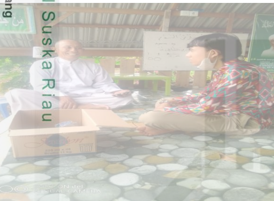
Gambar 3 Wawancara Dengan Ketua Masjid Sab'atun Indra