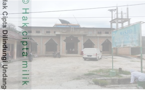
Gambar 1 Masjid Sab'atun Indra

2. Dilarang mengutip, sebagian atau seluruh karya tulis ini tanpa menyebutkan dan menyebutkan sumber. a. Pengutipan hanya untuk kepentingan pendidikan, penelitian, penulisan karya ilmiah, penyusunan laporan, penulisan kritik atau tinjauan suatu masalah b. Pengutipan tidak merugikan kepentingan yang wajar UIN Suska Riau. 2. Dilarang mengumumkan dan memperbanyak sebagian atau seluruh karya tulis ini dalam bentuk apapun tanpa izin UIN Suska Riau.