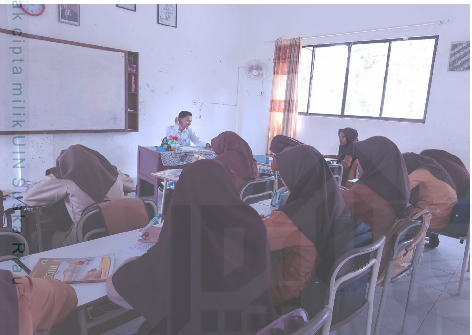
© Hak cipta milik UIN Suska Riau