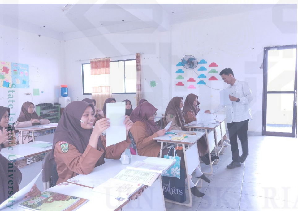
State Islamic University of Sultan Syarif Kasim Riau