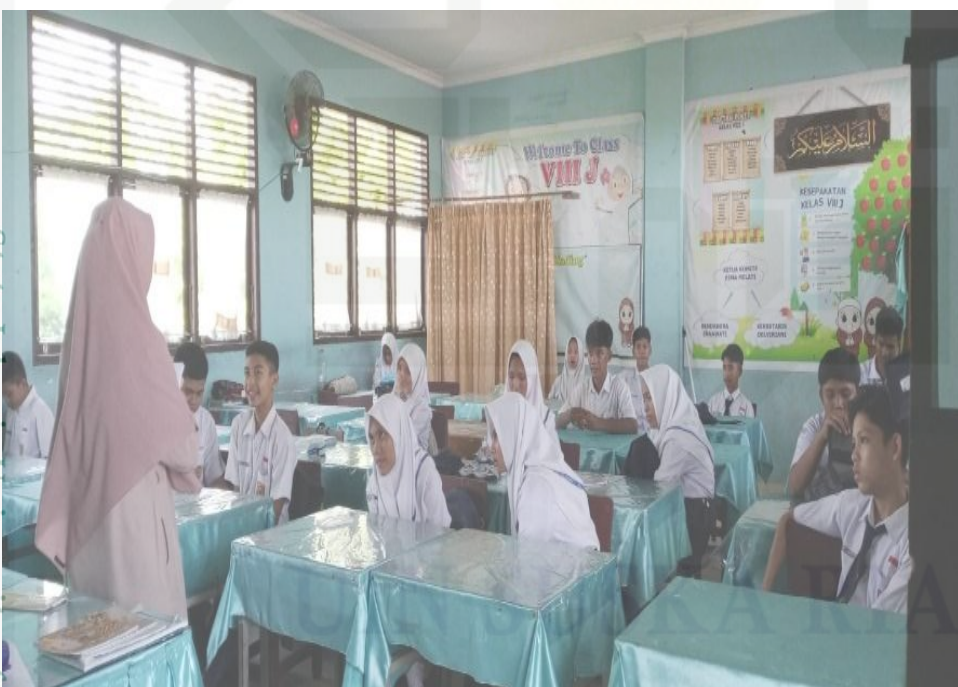
State Islamic University of Sultan Syarif Kasim Riau