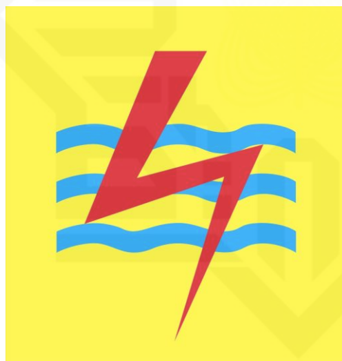
Gambar 2.1 Logo PLN