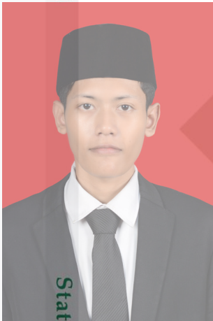
State Islamic University of Sultan Syarif Kasim Riau

Untuk memenuhi sebagian persyaratan mencapai gelar Sarjana S1 pada Program Studi Manajemen Pendidikan Islam