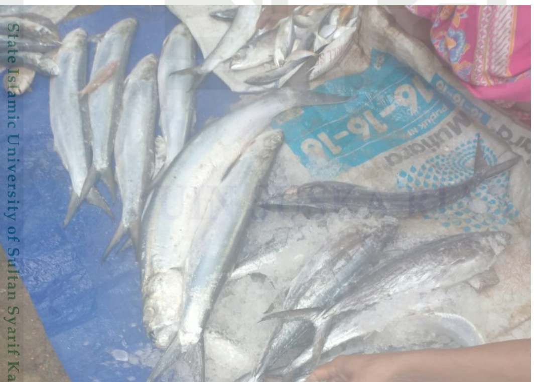
State Islamic University of Sultan Syarif Kasim Riau