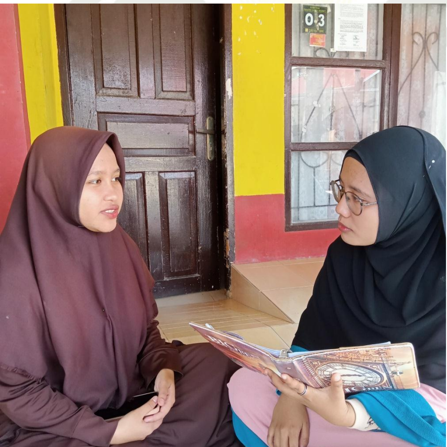
State Islamic University of Sultan Syarif Kasim Riau