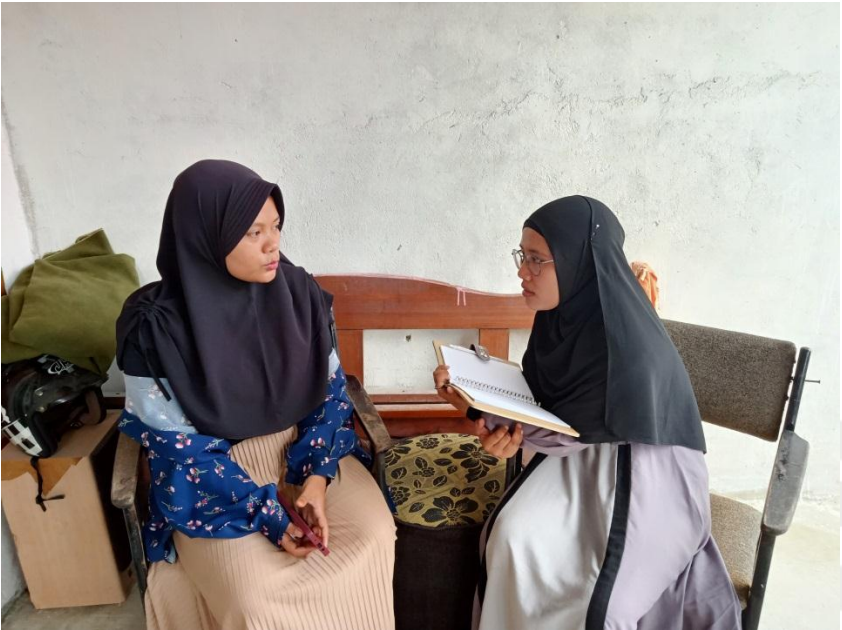
© Hak cipta milik UIN Suska Riau