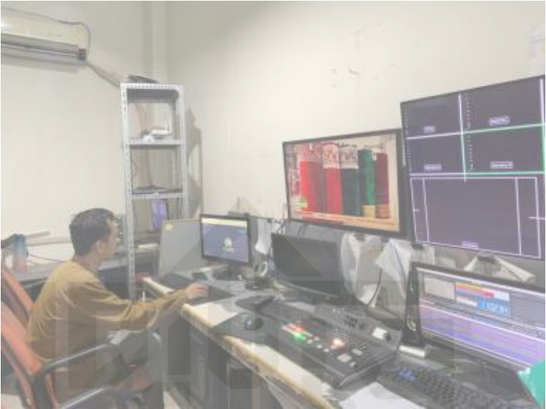
Sesi dokumentasi saat mengelola YouTube Padang TV