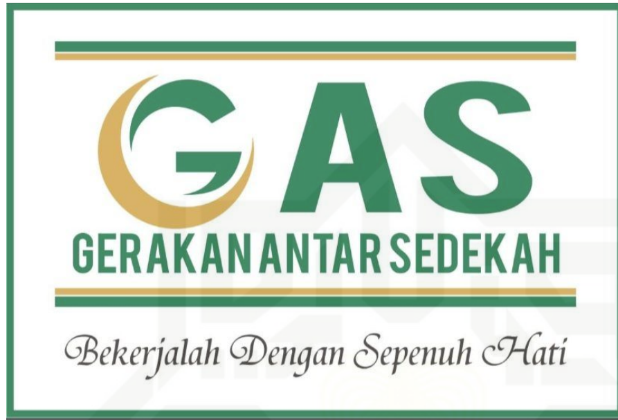
Gambar 4.1 Logo Gerakan Antar Sedekah