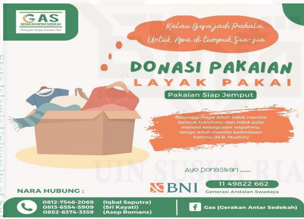
Poster penggalangan pakaian layak pakai