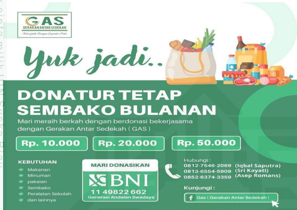
Poster penggalangan dana untuk menjadi donator