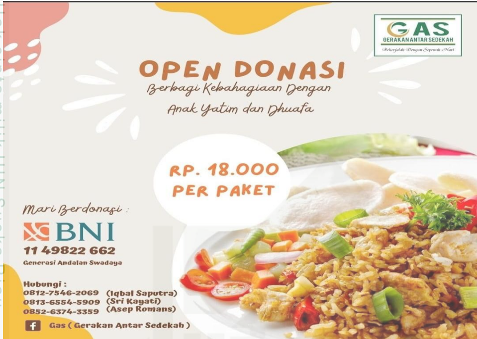
Poster open donasi untuk program paket berbuka