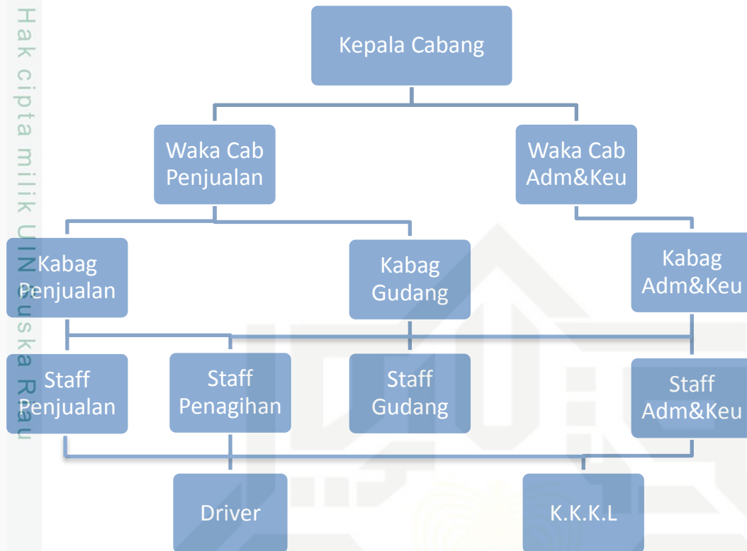
Gambar 2.1 Struktur Organisasi PT. Karya Suka Abadi Pekanbaru