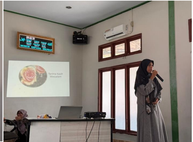
Penyampaian Materi oleh Narasumber