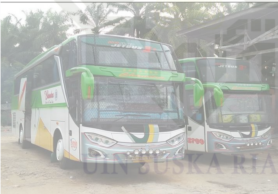
Gambar 6. Dokumentasi Transportasi BUS PT. CHandra