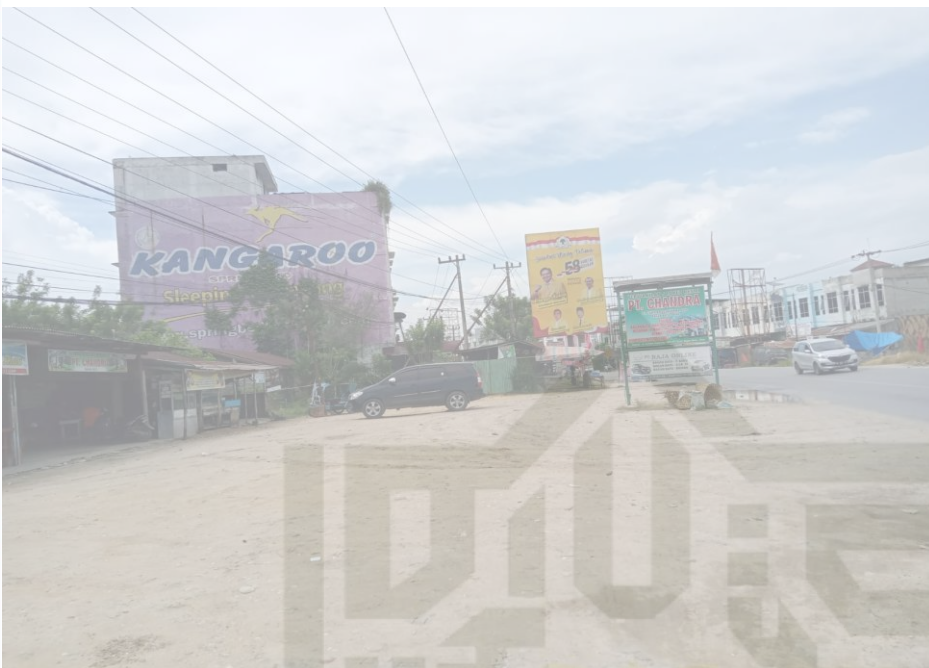
Gambar 5. Dokumentasi Loket Penjualan Tiket Bus Transportasi Darat PT. CHandra