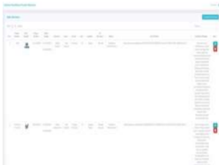
Gambar 3.1 Halaman Alternatif

Berikut tampilan dari halaman alternatif, pada halaman ini bisa menambah, edit, hapus alternatif: