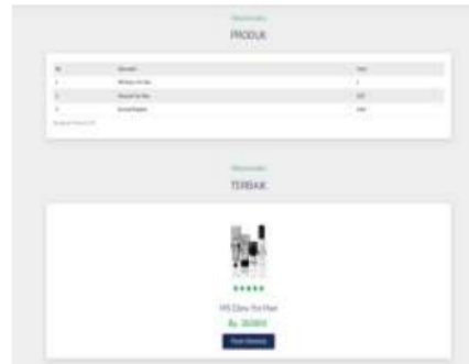
Gambar 3.4 Halaman Hasil Perangkingan

Pada halaman proses SAW berjalan hingga hasil perangkingan, berikut adalah hasil perangkingan rekomendasi skincare setelah menginputkan keluhan wajah: