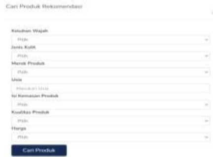
Gambar 3.3 Halaman Keluhan Wajah

Di halaman user bisa menginputkan keluhan yang ada pada wajahnya. Berikut merupakan tampilan untuk mencari produk skincare yang cocok dengan keluhan wajah: