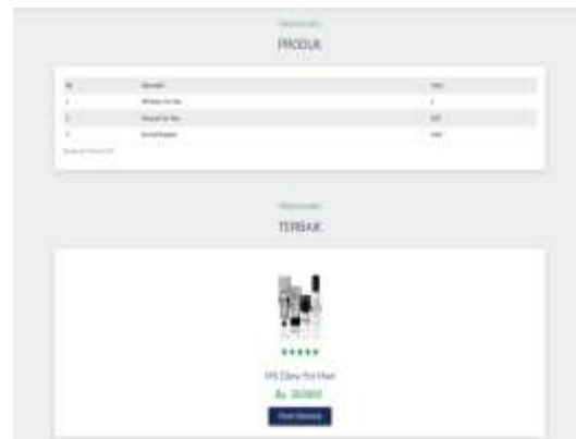
Gambar 3.4 Halaman Hasil Perangkingan

Pada halaman proses SAW berjalan hingga hasil perangkingan, berikut adalah hasil perangkingan rekomendasi skincare setelah menginputkan keluhan wajah: