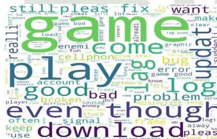
Gambar 11. Word cloud sentimen negatif