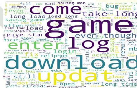
Gambar 10. Word cloud sentimen netral