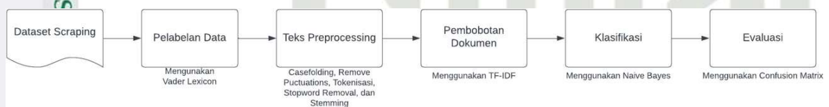
Gambar 1. Gambar Tahapan Penelitian

Tahapan penelitian bertujuan untuk menggambarkan alur penelitian yang akan dilakukan. Ada 6 tahapan yang akan dilakukan dalam penelitian ini yaitu pengumpulan data, pelabelan data, text preprocessing , pembobotan dokumen, klasifikasi, dan evaluasi. Gambar 1 menunjukkan alur dalam proses penelitian.