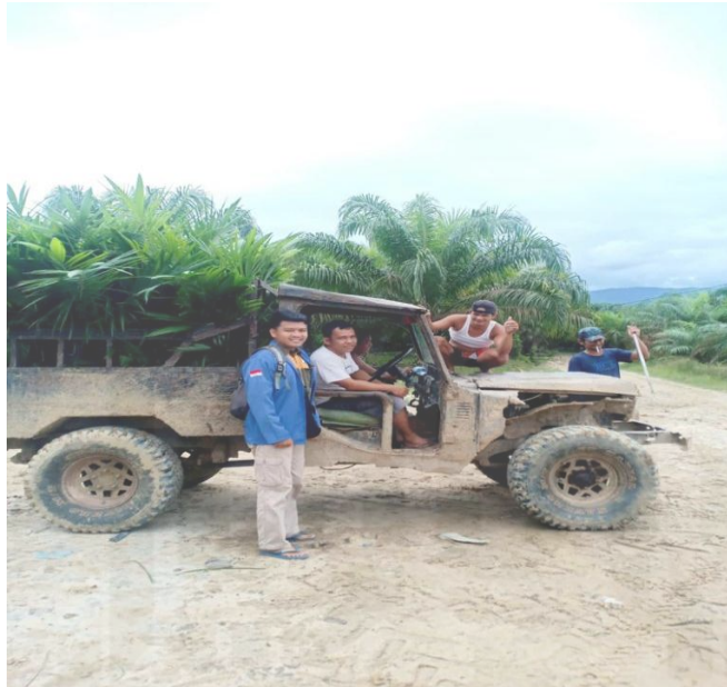
Gambar 4.5 Proses Pengangkutan Bibit Kelapa Sawit