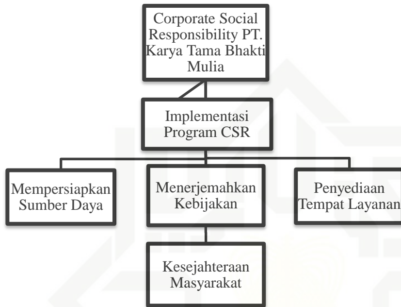
Gambar 2.1 Kerangka Pemikiran