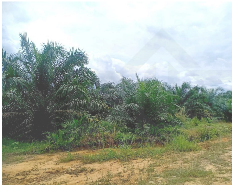
Gambar 4.2 Keadaan Sawit PT. Karya Tama Bhakti Mulia