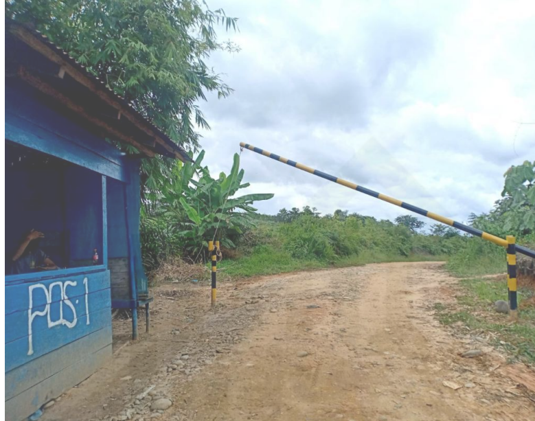
Gambar 4.1 Gerbang masuk PT. Karya Tama Bhakti Mulia