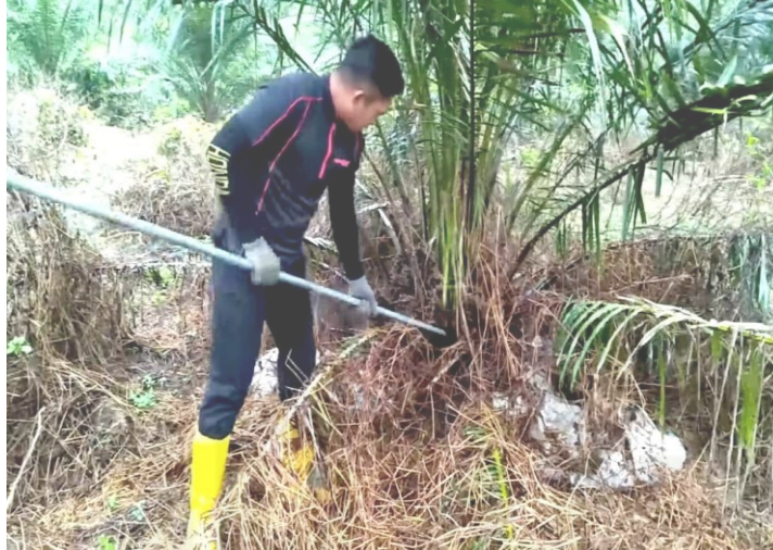
Gambar 4.6 Perawatan Sawit Dengan Pemangkasan Daun