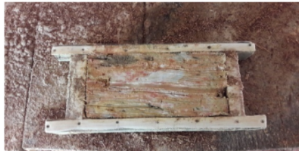
Gambar 3. Pencetakan Batu Bata Merah

Selanjutnya setelah diaduk bahan-bahan tadi dimasukkan kedalam cetakan yang sudah disediakan seperti yang terlihat pada gambar 3, adalah alat pencetak batu bata yang digunakan dalam penelitian ini. Cetakan yang dipakai terbuat dari kayu yang berbentuk balok, Tanah liat yang di masukan kedalam cetakan tersebut di padatkan dan diratakan pinggirannya supaya batu bata tidak hancur atau patah.