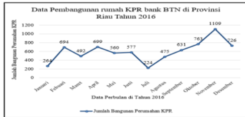
Gambar1. Grafik Perkembangan Pembangunan Rumah KPR

Dari data diatas terlihat perkembangan pembangunan rumah KPR bank BTN perbulannya, Peningkatan permintaan KPR ini tentu berkaitan langsung dengan peningkatan kebutuhan bahan-bahan bangunan salah satu bahan bangunan yang sangat penting adalah batu bata merah. Batu bata merah ini dikenal secara luas karena merupakan salah satu bahan bangunan dasar yang praktis pemakaiannya dan bersifat kuat. Sementara bahan bakunya hanya terdiri dari tanah liat dan air (Handayani, 2010).