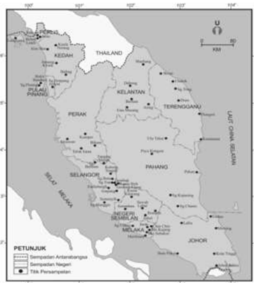
Gambar1. 55 Stasiun hujan di Semenanjung Malaysia

Data hujan setiap jam selama 37 tahun (1971-2008) yang diperoleh dari 55 stasiun hujan diberbagai daerah Semenanjung Malaysia akan digunakan dalam penelitian ini. Dua sifat hujan di atas akan diramalkan dengan menggunakan data hujan tersebut. Data untuk posisi letak stasiun – stasiun hujan tersebut dalam bentuk letak lintang dan bujur juga digunakan untuk memudahkan dalam membuat pemetaan dua sifat hujan di atas.dalam meramal dua sifat hujan yang telah dibicarakan di atas. Letak stasiun-stasiun hujan tersebut telah dihasilkan, seperti yang digambarkan pada gambar 1.