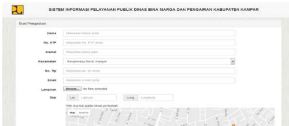
Gambar 3. Halaman pengaduan