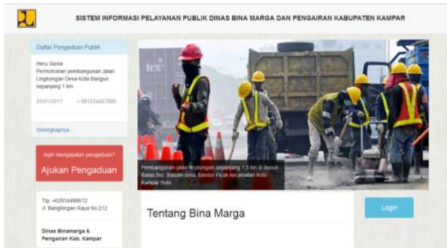
Gambar 2. Halaman utama