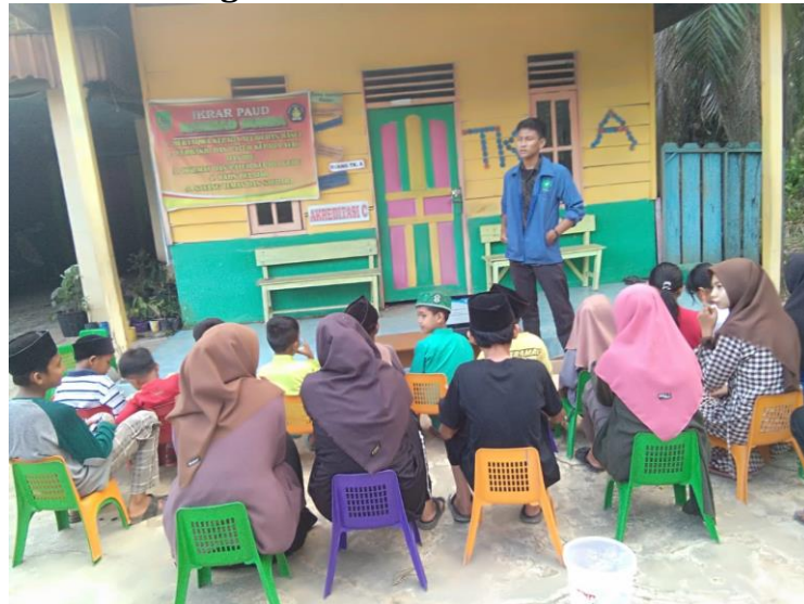
Gambar 2. Proses Pengarahan sosialisasi tentang internet