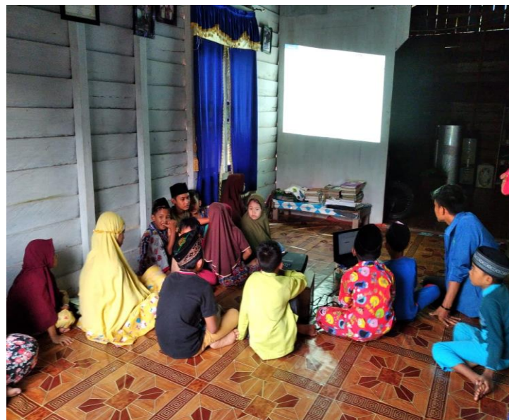
Gambar 3. Pembimbingan Microsoft Word