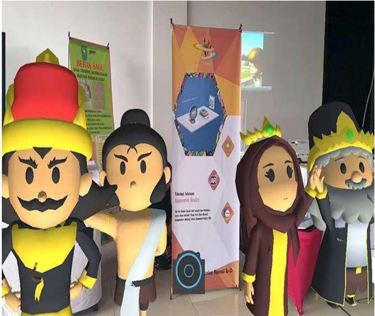
Dokumentasi saat Pameran