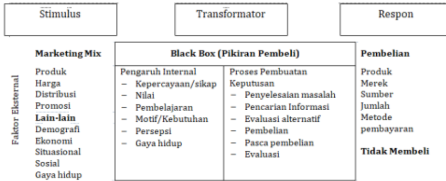
Gambar 2. Black Box Model

Berdasarkan Gambar 2, seorang konsumen bersentuhan dengan rangsangan eksternal dari bauran pemasaran bisnis dan rangsangan eksternal lainnya, dan mereka memprosesnya dalam pikiran mereka (kotak hitam). Mereka menghubungkan rangsangan eksternal dengan pengetahuan yang sudah ada sebelumnya, seperti keyakinan dan keinginan pribadi, untuk membuat keputusan. Singkatnya, model ini mengatakan bahwa konsumen adalah pemecah masalah yang membuat keputusan setelah menilai bagaimana produk akan memuaskan keyakinan dan kebutuhan mereka yang ada. Karena konsumen hanya menindaklanjuti dengan pembelian setelah memahami bagaimana suatu produk berhubungan dengan pengalaman mereka, model ini dapat menguntungkan bisnis yang menjual produk yang sesuai dengan gaya hidup.