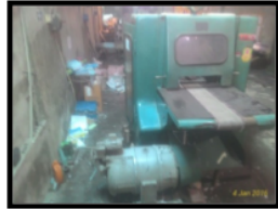
Gambar 1.1 Barang-Barang Disekitar Mesin Tidak Tersusun Rapi

Berikut adalah gambaran mengenai lingkungan kerja PT Sutra Benta Perkasa pada lantai produksi.