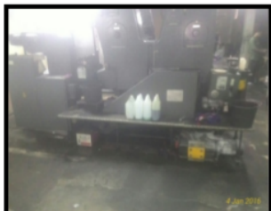
Gambar 1.3 Mesin Cetak

Beberapa permasalahan dalam analisa menggunakan metode 5S yang terjadi pada stasiun percetakan sebagian besar terdapat pada kondisi lantai produksi yang tidak bersih, tidak rapi, serta tidak teratur.