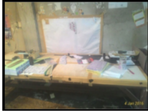
Gambar 1.4 Meja Pekerja

Beberapa permasalahan dalam analisa menggunakan metode 5S yang terjadi pada stasiun pelipatan sebagian besar terdapat pada kondisi lantai produksi yang tidak bersih, tidak rapi, serta tidak teratur.