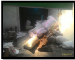
Gambar 1.6 Tempat Pembuangan Limbah

Pada tempat pembuangan limbah dilakukan beberapa usulan perbaikan berdasarkan beberapa permasalahan yang ada pada stasiun ini. Aspek yang paling bermasalah pada tempat pembuangan limbah ini adalah adanya beberapa kegiatan yang belum memenuhi kategori seiri , seiton , seiso , seiketsu , dan shitsuke .