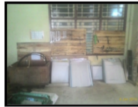
Gambar 1.5 Tempat Penyimpanan Peralatan