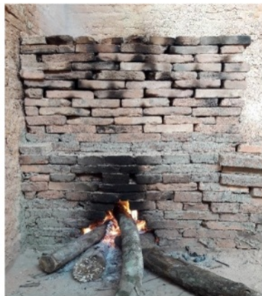
Gambar 4. Proses Pembakaran