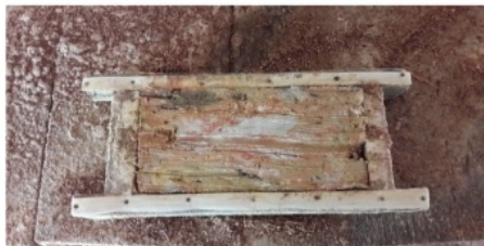
Gambar 3. Pencetakan Batu Bata Merah