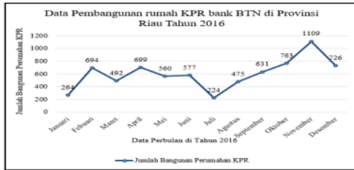
Gambar1. Grafik Perkembangan Pembangunan Rumah KPR

Dari data diatas terlihat perkembangan pembangunan rumah KPR bank BTN perbulannya, Peningkatan permintaan KPR ini tentu berkaitan langsung dengan peningkatan kebutuhan bahan-bahan bangunan salah satu bahan bangunan yang sangat penting adalah batu bata merah. Batu bata merah ini dikenal secara luas karena merupakan salah satu bahan bangunan dasar yang praktis pemakaiannya dan bersifat kuat. Sementara bahan bakunya hanya terdiri dari tanah liat dan air (Handayani, 2010).