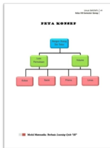
Gambar 2. Desain Peta Konsep

Untuk tampilan peta konsep dapat dilihat pada gambar berikut.