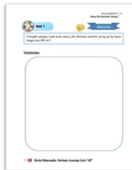
Gambar 5. Desain Tahap Elaboration