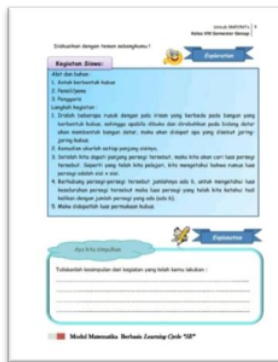
Gambar 4. Desain Tahap Exploration dan Explanation