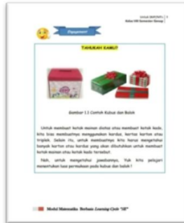
Gambar 3. Desain Tahap Engagement