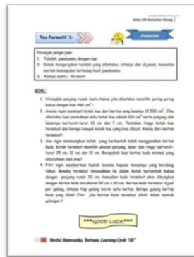
Gambar 6. Desain Tahap Evaluation

Setelah modul berbasis model Learning Cycle “5E” selesai di desain, selanjutnya modul tersebut di validasi oleh validator ahli teknologi pendidikan dan ahli materi pembelajaran dengan menggunakan angket. Angket yang digunakan untuk memvalidasi modul terlebih dahulu divalidasi oleh ahli instrumen sesuai dengan kisi-kisi angket. Angket yang telah dinyatakan valid tersebut kemudian digunakan untuk memvalidasi modul yang dikembangkan. Berikut hasil validasi oleh ahli materi pembelajaran.