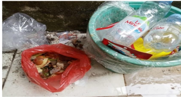
Gambar 1. Proses Pemilahan Sampah

upaya sanitasi dan kebersihan lingkungan juga bisa menambah penghasilan dari menukar sampah atau menjual sampah yang masih bisa didaur ulang di bank sampah.